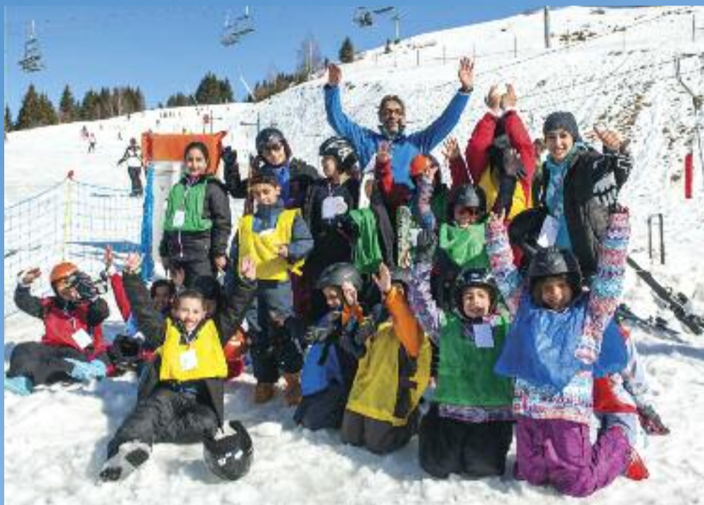
Presque treize heures, les estomacs réclament pitance ! Le groupe resté en bas des pistes s'impatiente. Il reste encore quelques uns qui dévalent les pistes. Avant d'aller chercher le casse-croute, la photo de groupe s'impose. Trois, deux, un : le petit oiseau sort !