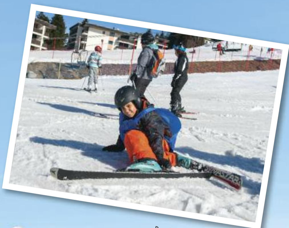
Dur, dur de tenir debout avec ses skis ! Avec un peu de patience et de détermination, on y arrive toujours.